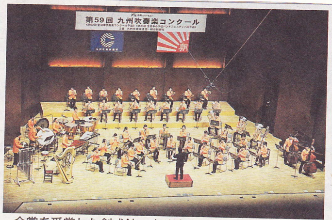
金賞を受賞した創成館＝大分市