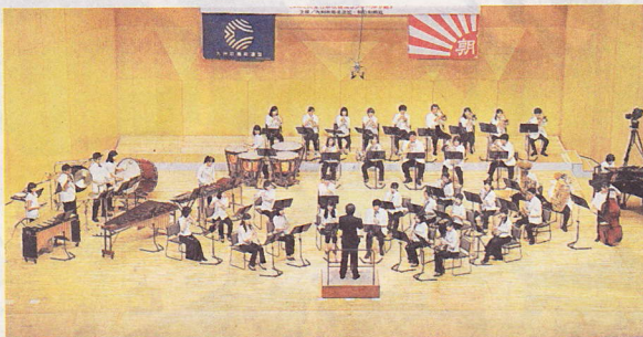
諫早吹奏楽団の演奏