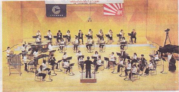
ナガサキ・ウインド・オーケストラの演奏